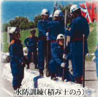
水防訓練(積み土のう)