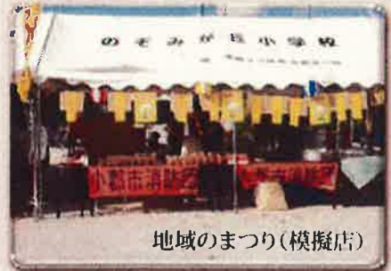
地域のまつり(模擬店)