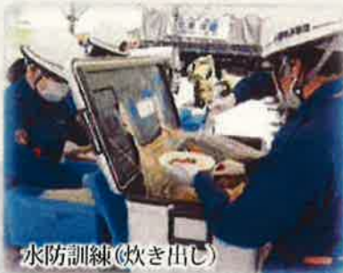
水防訓練(炊き出し)