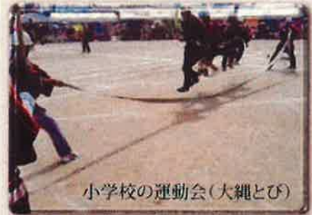
小学校の運動会(大縄とび)