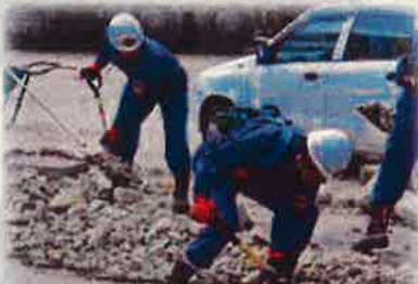
九州北部豪雨被災地での活動