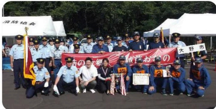
～県大会3位入賞（8分団）～