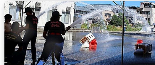
～少年消防クラブ夏季研修会～