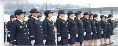
～大野市消防総合訓練～