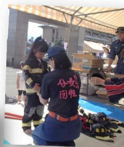
～消防ふれあい広場～