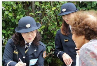
～高齢者宅防火訪問～