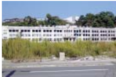
被災した門脇小学校