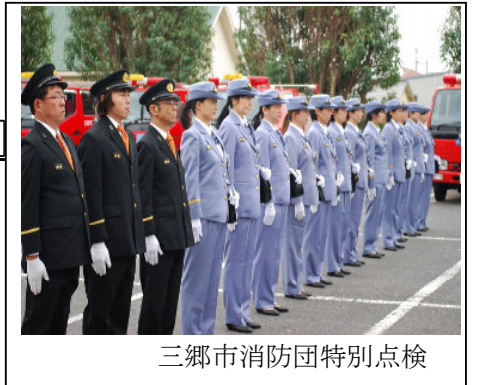
三郷市消防団特別点検

皆様から寄せられる熱い希望にお応え出来るように、アザレア分団一丸となって今年度も取り組んでいきます!! 宜しくお願い致します。