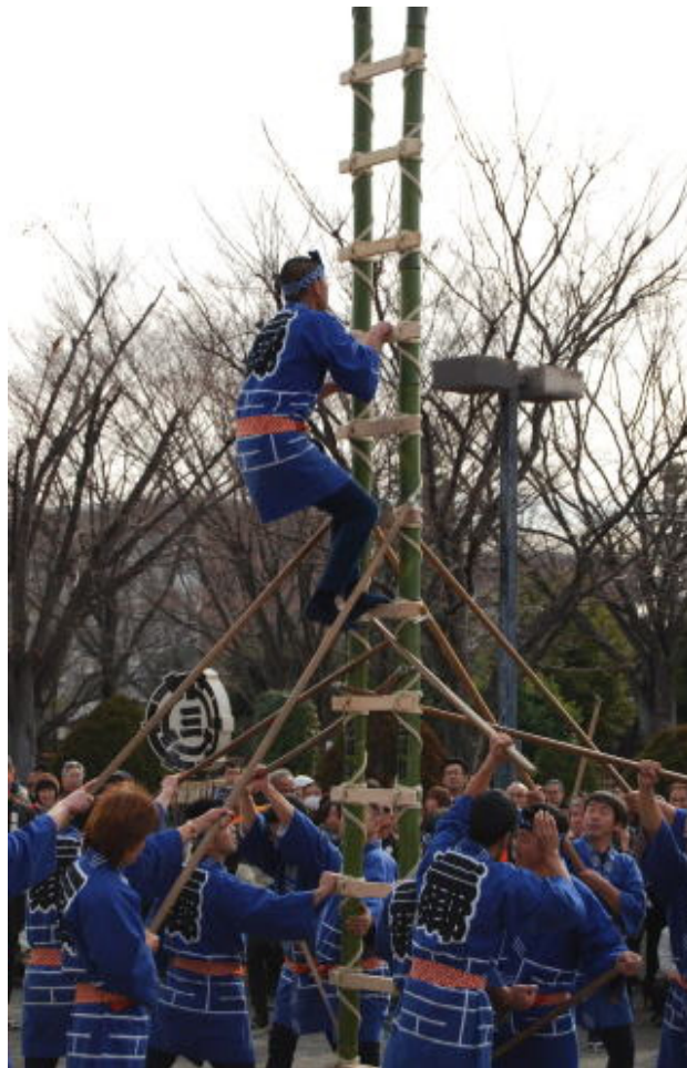
江戸時代の町火消の伝統をいまに伝えるものです。