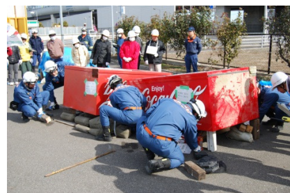
自動販売機転倒救出訓練