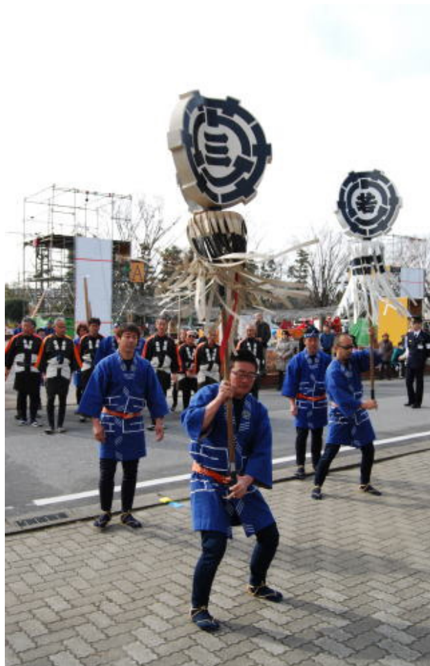
はしご乗り（三郷鳶組合）