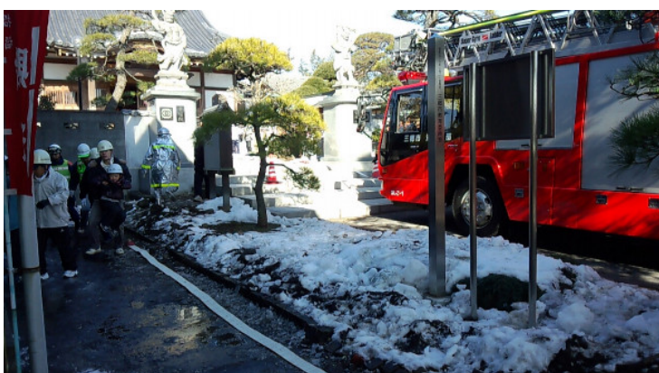
文化財を守りましょう！

平成25年1月20日（日）に三郷市早稲田の光福院にて、丹後上町会自主防災会合同で文化財防火訓練が開催されました。