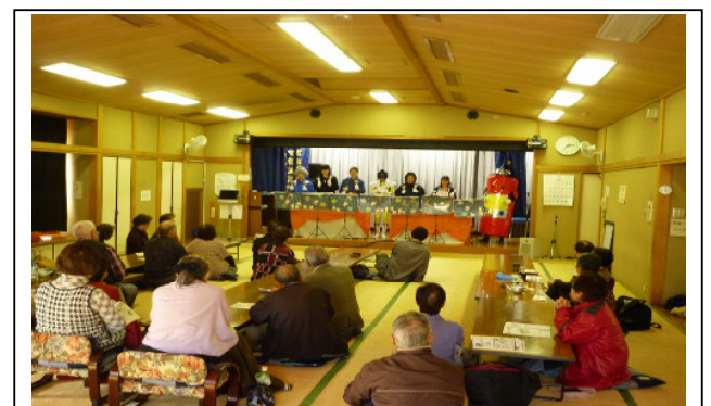
彦沢老人センター防火訪問