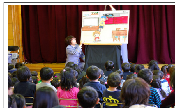
早稲田保育所防火訪問