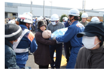
ブロック倒壊による救出・救助訓練